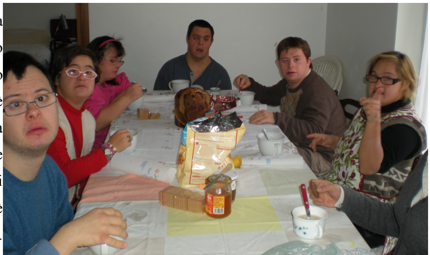
TUTTI A COLAZIONE