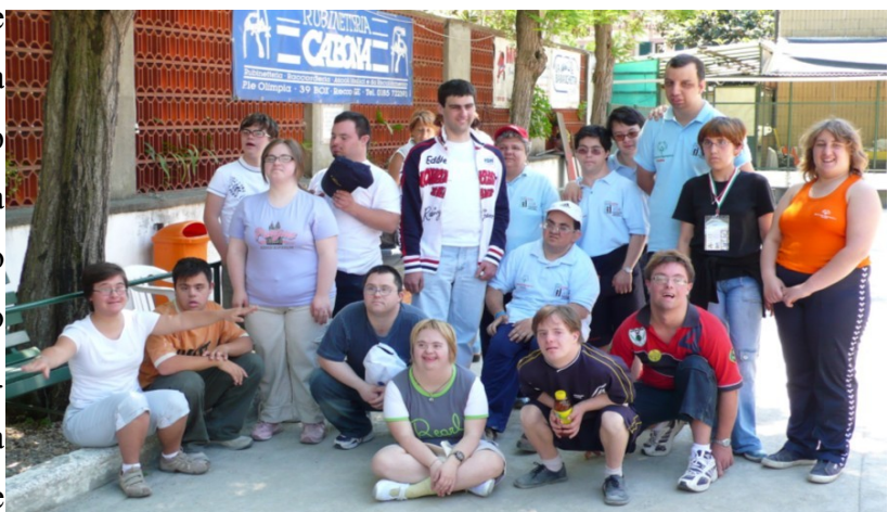
LA SQUADRA DI BOCCE

Il cavallo invece è un animale erbivoro, il giorno che sono andata sul cavallo ai tempi di is.foor.coop io ero stata la prima a salire sulla sella. Sono andata molte volte. Ho fatto il galoppo e il trotto, sono andata da sola con il frustino. Quando siamo seduti sulla sella bisogna batterla con il sedere, con le