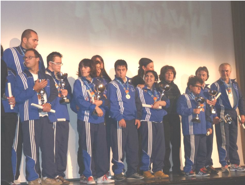
UNA PREMIAZIONE ALLE SPECIAL OLYMPICS DI ATENE