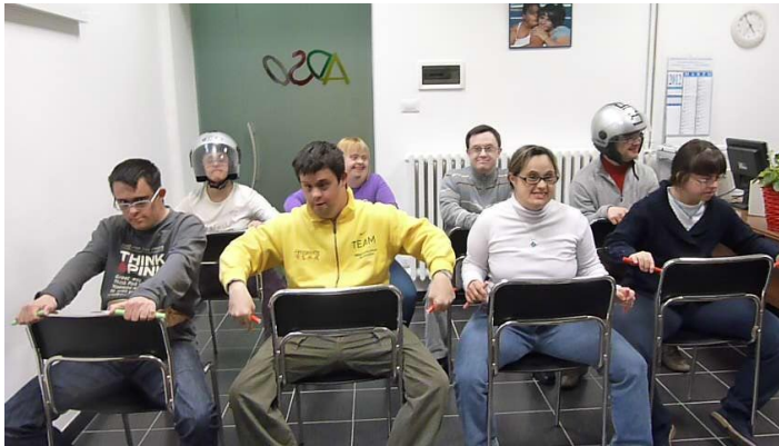
TUTTI IN MOTO

Siamo saliti in macchina abbiamo acceso i motori come se andassimo a correre su una pista.