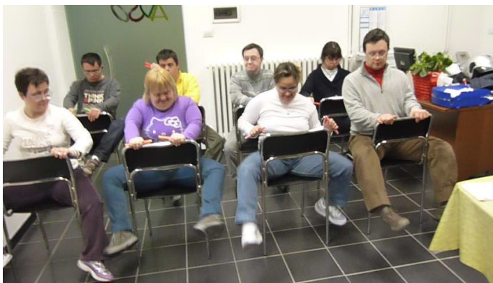
TUTTI IN BICI

Abbiamo fatto delle foto siamo andati in moto, ma per scherzo e abbiamo fatto anche il cavallo. Mi sono piaciuti tanto.