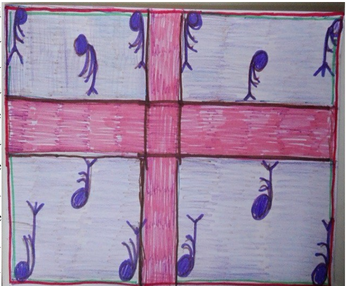
Il campo di pallavolo durante il gioco