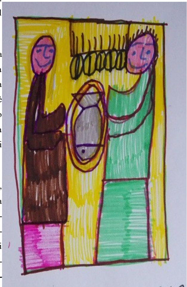
A PROPOSITO DI CIBO: il miracolo dei pani e dei pesci